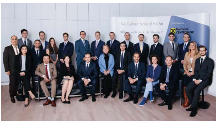
Das erfolgreiche Team „Strukturierte Produkte“ der Raiffeisen Centrobank